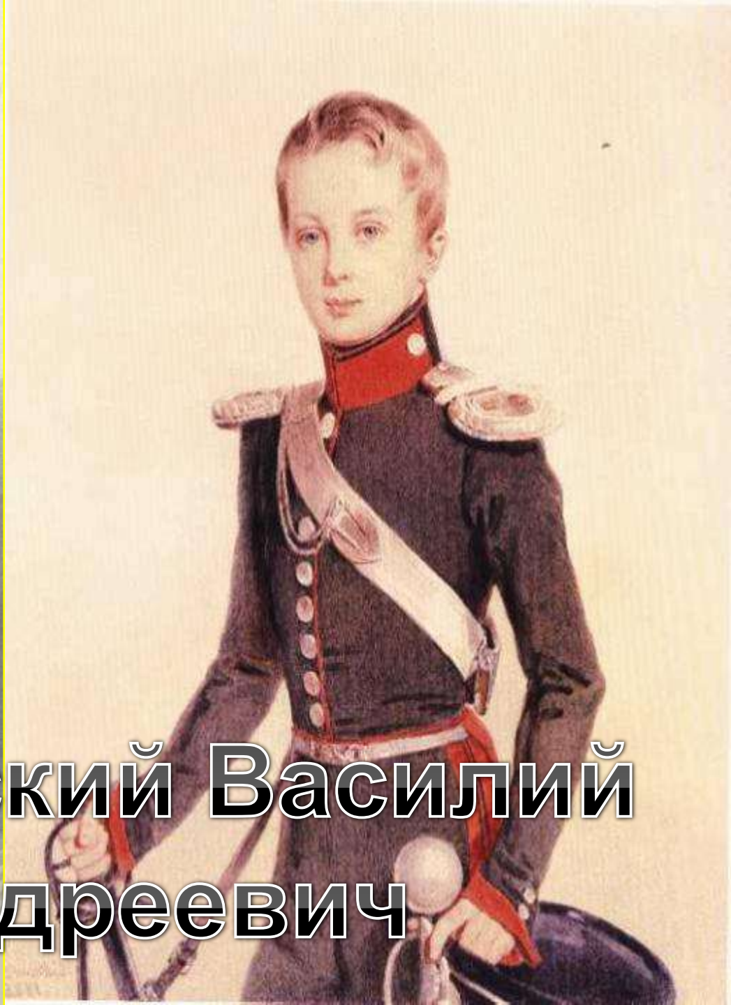
Жуковский Василий Андреевич